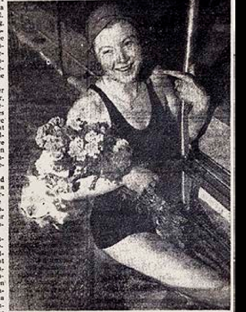
Inge Sørensen med sin Blomsterbuket efter at have svømmet Eresrunde.

DA Skovserpigen, „Danmarks lille henrivende Inge“ vendte hjem i 1938 efter at have vundet Europamesterskabet i London, blev hun fejret med stor Mod-